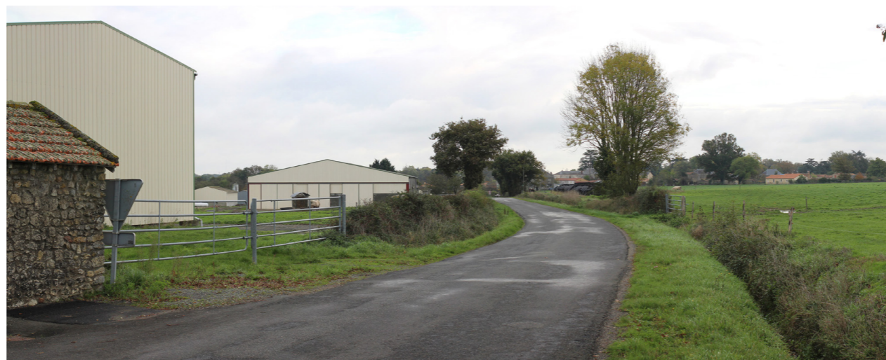
Photographie de l'état initial à 50°